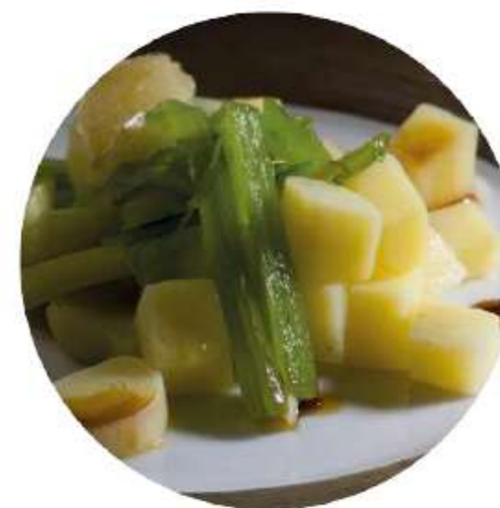
La borraja es una verdura habitual en los platos de Aragón y Navarra.

Escurridas, con unas patatas cocidas y un poco de aceite natural, están deliciosas. Sencilla, sana y cien por cien natural.