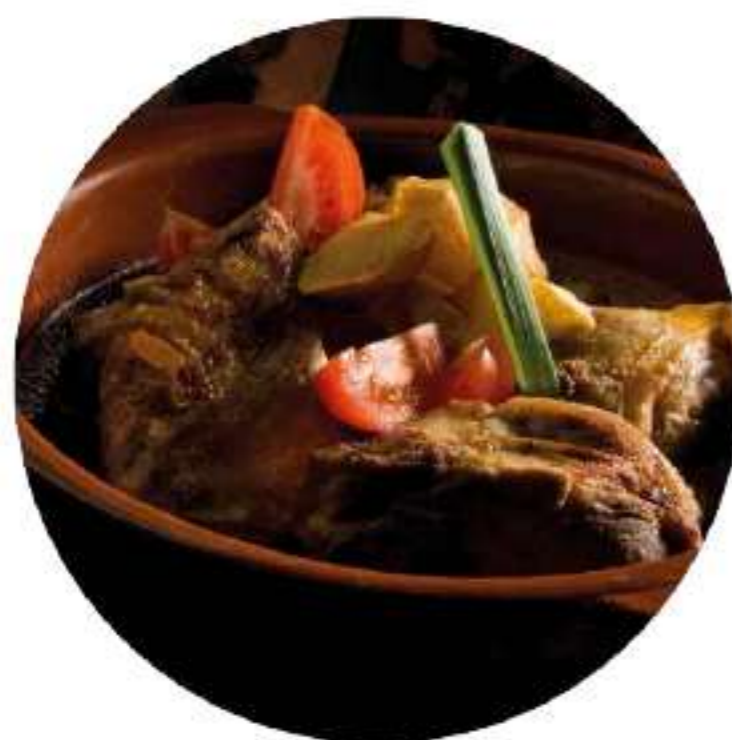
El ternasco asado es una de las recetas emblemáticas de Aragón.

Si fuera necesario, se puede calentar todo de nuevo en la sartén ya libre de aceite.