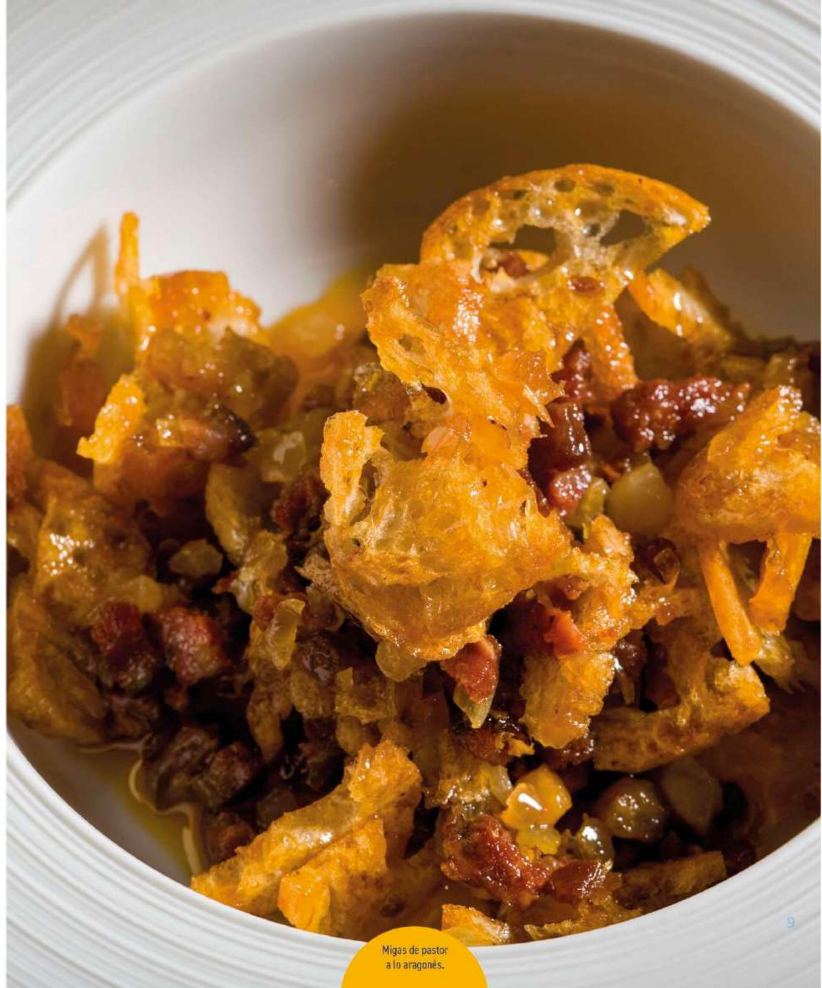
Migas de pastor a lo aragonés.

Según el Instituto de Estudios Oscenses, así se hacían antaño: «Se corta el pan en hojas finas, rozando de cuando en cuando al fuego sebo y tocino en trozos menudos y un poco de aceite; una vez deshecho todo, se echan las migas y se revuelven; cuando han empapado la grasa se añade un poco de agua, sin dejar de revolver, y cuando están muy calientes, se comen suavizándolas con un poco de aceite crudo».