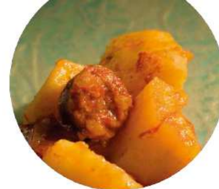
Patatas a la riojana.

Opcional: antes de servir, se pueden agregar los huevos batidos, en dosis sucesivas, para que se coagulen.